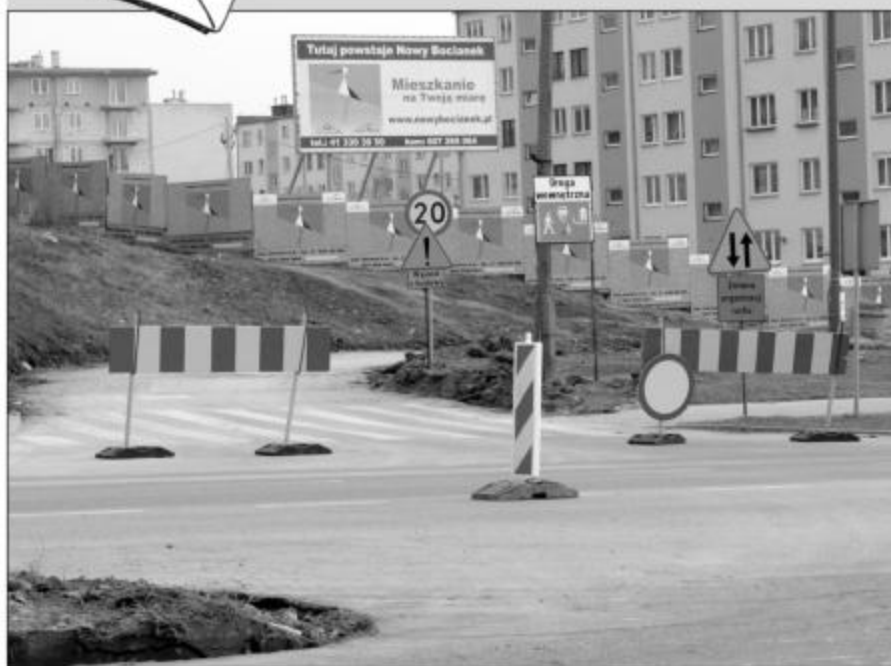
Prace przy wyjeździe / wjeździe już trwają...