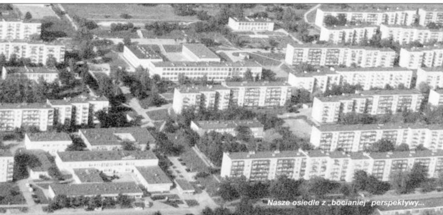
Nasze osiedle z „bocianiej” perspektywy...

Dodatkowe informacje można uzyskać w pokoju nr 6 oraz pod nr tel. 41 331 56 73 wew. 23.