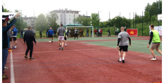
W turnieju wzięło około 200 osób.

Kibice dziękują sponsorom: Grande Pizza, Fanatykk, Trofex, Decathlon, Vitamin-Shop, Uniwerek, Dom Chleba, Zemax, Gin-Ger Sport.