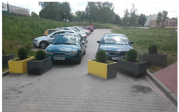
Przejazd ulicą Wyspiańskiego do ulicy Boya-Żeleńskiego został zablokowany dużymi donicami z zielenią.

Zadowolenie z tego rozwiązania wyraża zdecydowana większość mieszkańców Nowego Bocianka.