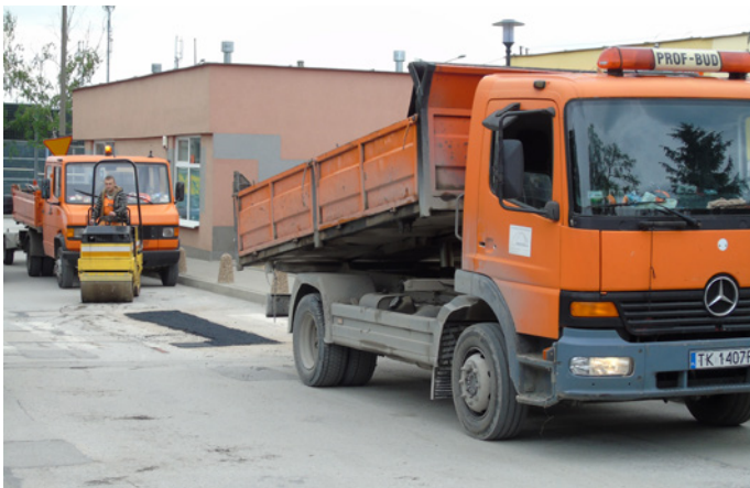
Przez kilka tygodni trwała akcja łatania dziur w ulicach na terenie osiedla Bocianek.

Sto metrów kwadratowych nowego asfaltu ułożono na terenie Bocianka w ramach tegorocznej akcji naprawiania osiedlowych ulic.