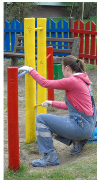
Młodzież z Zespołu Szkół Zawodowych nr 1 w Kielcach pod okiem swoich nauczycieli odnowił place zabaw na terenie osiedla.

Uczniowie Zespołu Szkół Zawodowych nr 1 w Kielcach wyremontowali place zabaw na terenie osiedla Bocianek. Prace wykonali w ramach praktyk zawodowych, a spółdzielnia zapłaciła tylko za materiał.