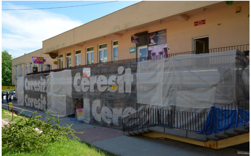
W maju rozpoczął się remont galerii komunikacyjnej w pawilonie przy ul. Konopnickiej 5. Prace mają się skończyć lada dzień.

- Dlatego zanim przystąpiliśmy do remontu, zlecieliśmy wykonanie ekspertyzy technicznej tarasu i dopiero na jej podstawie ustaliliśmy sposób remontu i zakres prac koniecznych do wykonania.