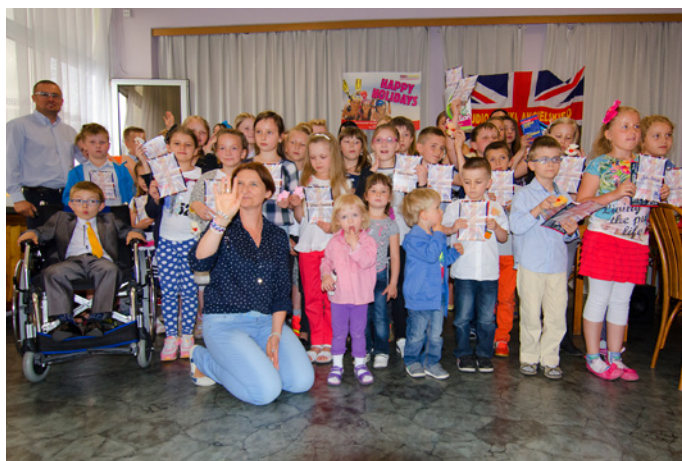
Podczas zakończenia roku szkolnego w SJA FP na Bocianku.

Warto dodać, że Studio Języka Angielskiego wychodzi poza ramy standardowego pojęcia szkoły. Organizuje dla dzieci i młodzieży spotkania integra-