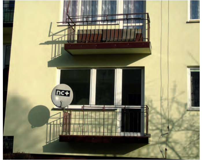
Tak blok prezentuje się obecnie.

Spółdzielnia odnowiła elewację bloku przy ulicy Konopnickiej 9 zniszczoną po pożarze, który wybuchł latem w jednym z tamtejszych mieszkań. Koszt naprawy pokryje Towarzystwo Ubezpieczeniowe Uniqa, w którym od lat ubezpieczone są bloki osiedla Bocianek.