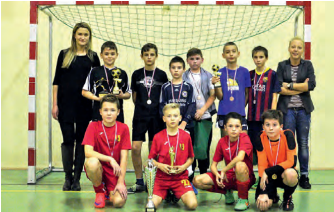
Zwycięzcy turnieju w kategorii rocznik 2003-2004.