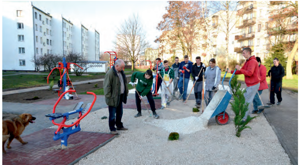
W zagospodarowaniu terenu przy siłowni pomogli uczniowie Zespołu Szkół Zawodowych nr 1 w Kielcach (kieleckiej „budowlanki”).

- Widzieliśmy, że sporo osób ćwiczy w siłowni zewnętrznej znajdującej się na pograniczu osiedla i parku Dygasińskiego, postanowiliśmy podobną stworzyć w zachodniej części Bocianka – mówi