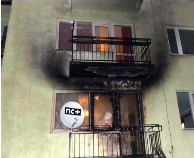
Tak wyglądał blok przy ulicy Konopnickiej 9 po pożarze.