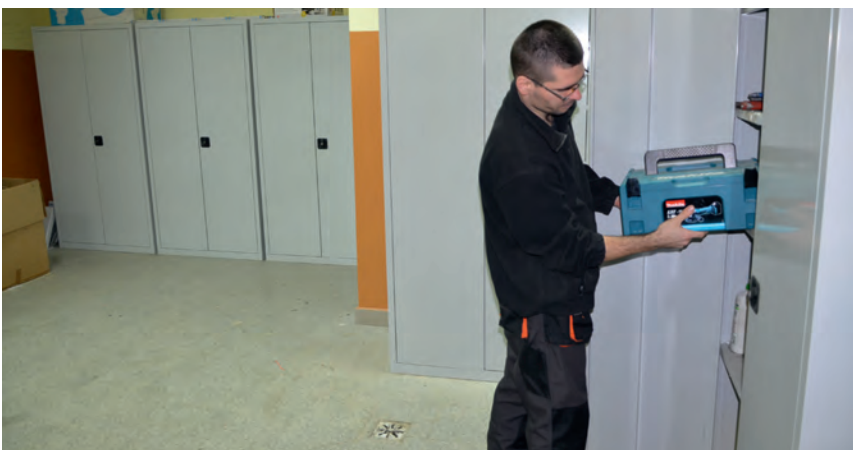
Wyremontowane i wyposażone w nowe szafy pomieszczenia konserwatorów.

W przyszłym roku władze spółdzielni zamierzają pomalować ściany i zabudować rury szpecące korytarz.