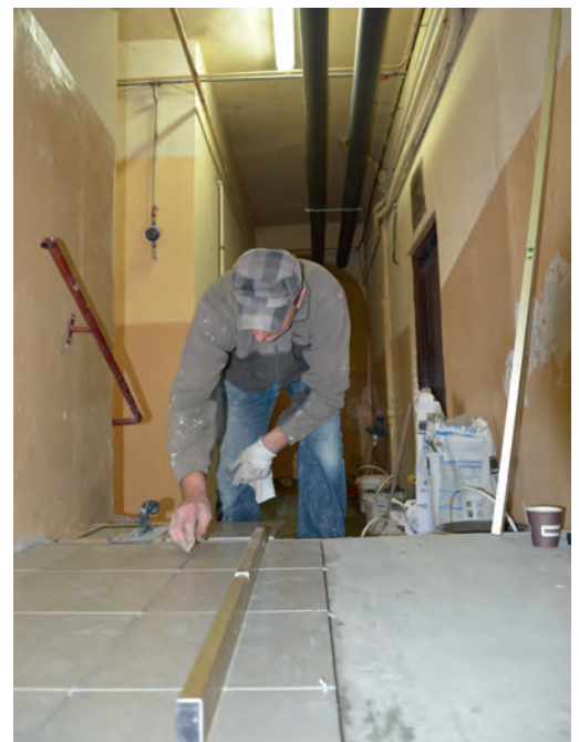
Remont korytarza obok Klubu Seniora.