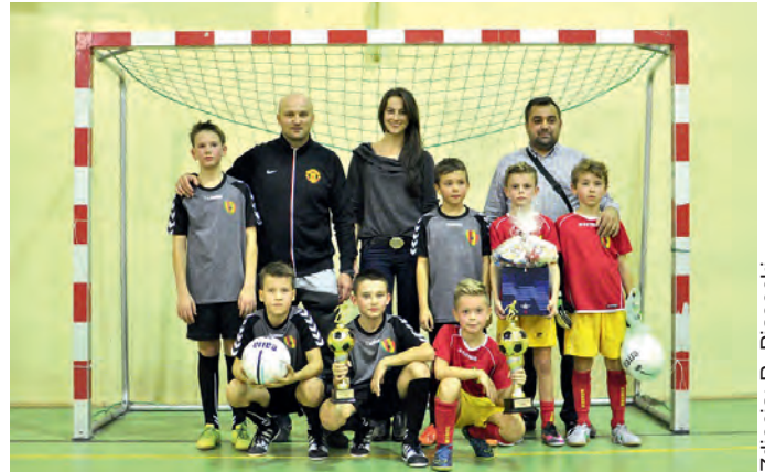
Zwycięzcy turnieju w kategorii rocznik 2005-2006.