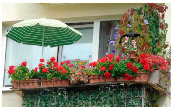
Ten balkon otrzymał drugie miejsce w konkursie.