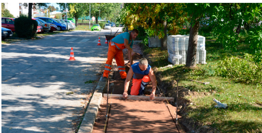
Budowa chodnika przy ul. Boya-Żeleńskiego.