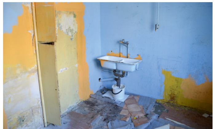
Mieszkanie dłużnika było w opłakanym stanie.

Na szczęście mieszkania na naszym osiedlu cieszą się sporym zainteresowaniem. W czasie licytacji cena wywoławcza ustalona została na poziomie 160 tys. zł. - Ostatecznie za mieszkanie udało się uzyskać bez mała 200 tysięcy złotych - powiedziała Edyta Sobczyk, główna księgowa SM Bocianek.