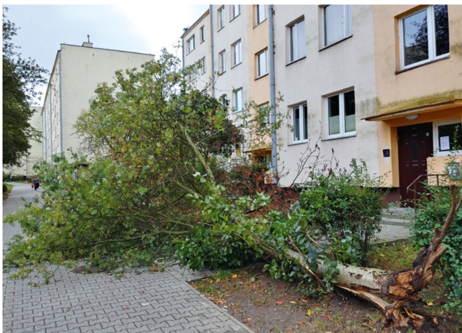
/AP/ Silny wiatr przewrócił jarzębinę, która zatarasowała wejście do bloku przy ul. Norwida 4.

- Silny wiatr zniszczył dwie jarzębiny i jedną wierzbę - poinformował Zbigniew Wieczorek, inspektor do spraw technicznych Spółdzielni Mieszkaniowej Bocianek. W najtrudniejszej sytuacji znaleźli się mieszkańcy bloku przy ul. Norwida, którym przewrócone drzewo zatarasowało wejście do klatki.