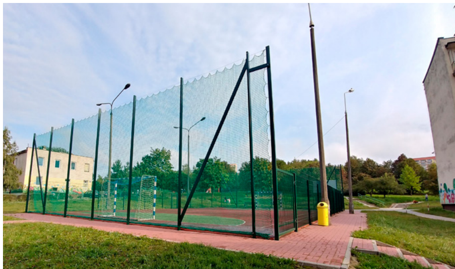
Na ogrodzeniu boiska zamontowano siatki, dzięki którym piłka nie uderza w ogrodzenie.

Władze spółdzielni wychodząc na przeciw oczekiwaniom mieszkańców oraz dbając o porządek na terenie osiedla wprowadziły nowy regulamin korzystania