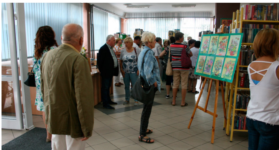
Wystawa cieszyła się dużym zainteresowaniem. Kilkadziesiąt osób przyszło na wernisaż.

- Jeśli będzie taka potrzeba, to chętnie zrobimy kolejny wernisaż nie tylko jednej osobie, ale nawet kilku - zapowiada kierownik Kamyk.