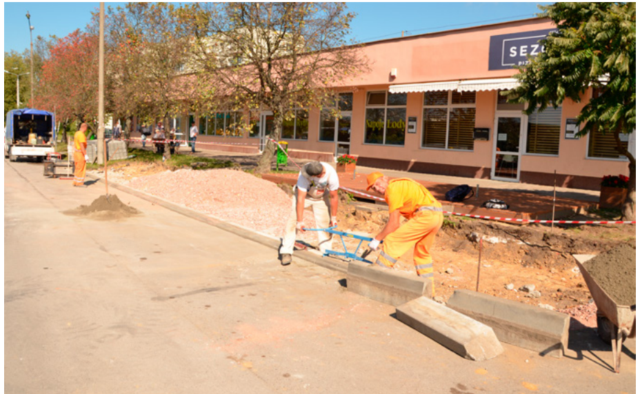
Parking przed pawilonami przy Konopnickiej 5 został przebudowany.

Dobra wiadomość dla klientów i właścicieli punktów usługowo-handlowych działających w pawilonach przy ul. Konopnickiej 5. Przed budynkiem powiększony został parking. Przybyło dziesięć nowych miejsc postojowych.