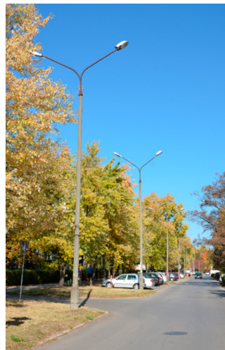
Spółdzielnia przejęła latarnie uliczne.